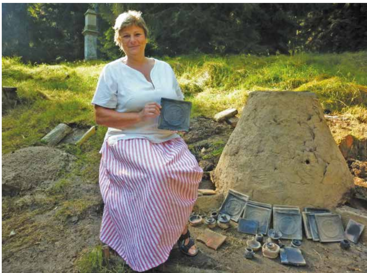
Obr. 6: V keramické peci byly vypáleny kopie čelních stěn místních historických kachlů.