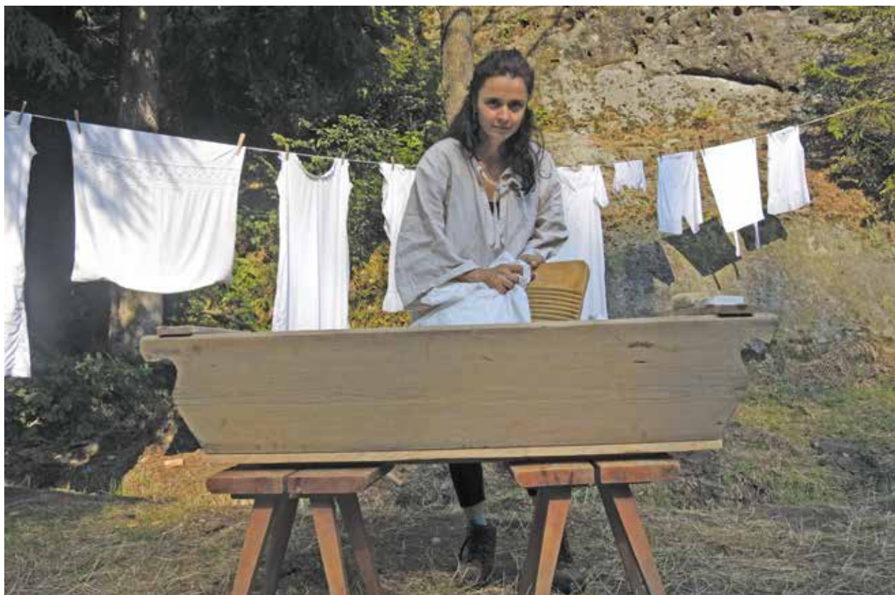
Obr. 5: Ukázky praní doplňoval i výklad o historii běličství.