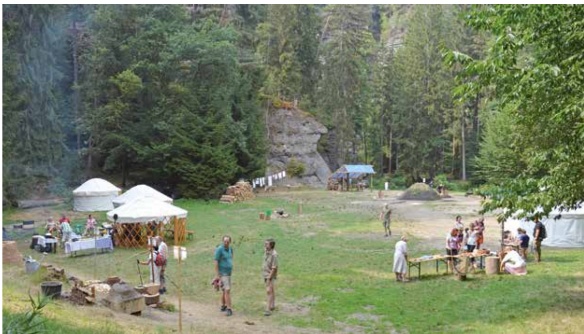
Obr. 1: Louka u Dolského mlýna, místo konání Dnů řemesel v Českém Švýcarsku. Vlevo smolný kámen, sušárna ovoce, keramická pec, chlebová pec a pec na oškvarky (obě mimo obraz). Uprostřed (za milířem) koutek věnovaný historii praní a bělení. Vpravo hrnčířský kruh a drátenický koutek. Za jurtou vpravo železářská pec. Jurty plní funkci zázemí a výstavního prostoru.

Osvěžení do ruchu řemeslníků přinesly koncerty Collegia Verbasca, Quitar Arte tria a Jany Vébrové – Šrajerové. Zlom počasí, co během akce ukončil období veder vydatným deštěm, zas umožnil všem účastníkům naplno prožít pocity našich předchůdců – lesních řemeslníků, jelikož ani ti nemohli od započatého díla v lesích uprchnout do sucha a bezpečí.