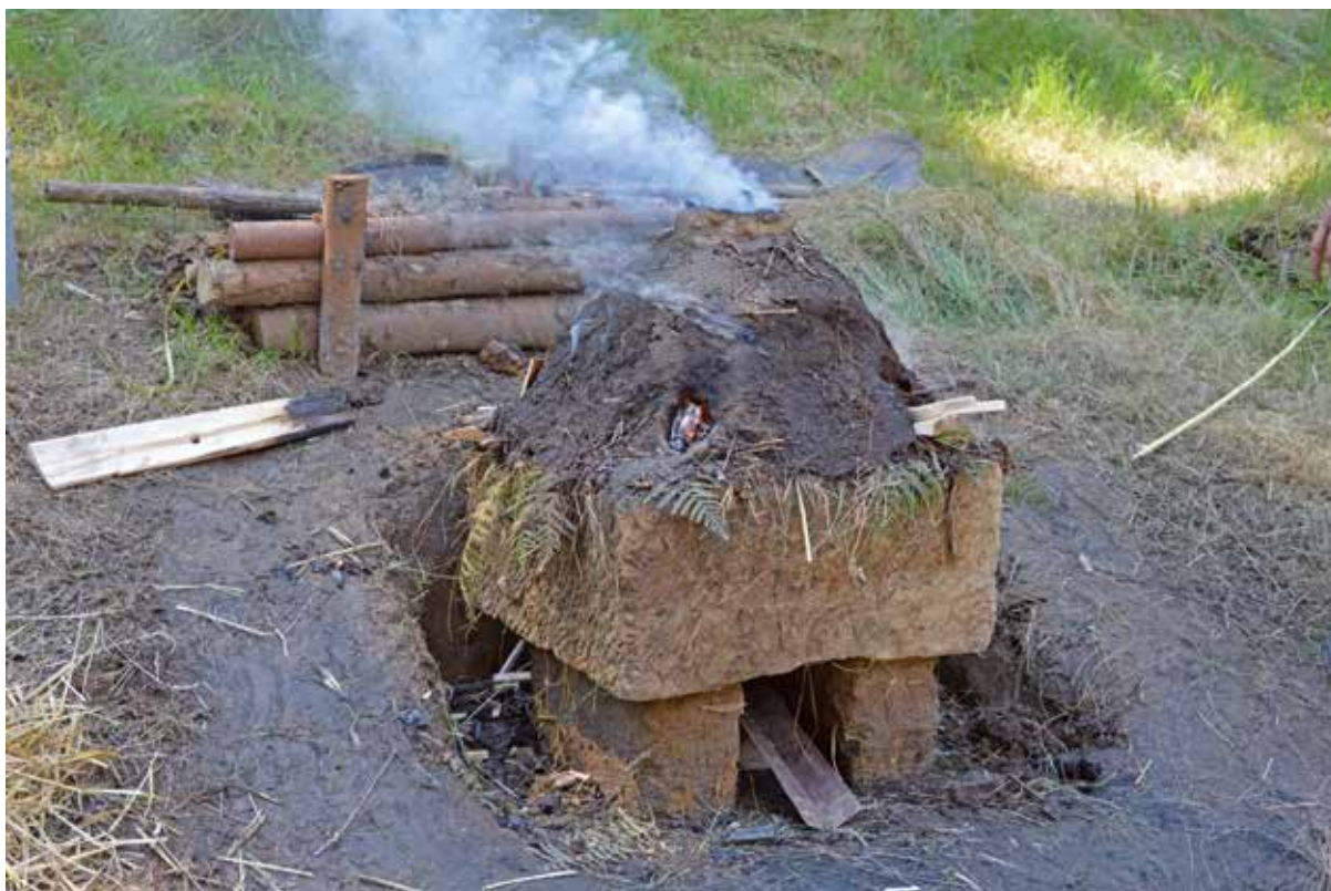
Obr. 2: Experimentální výroba dehtu na smolném kameni.