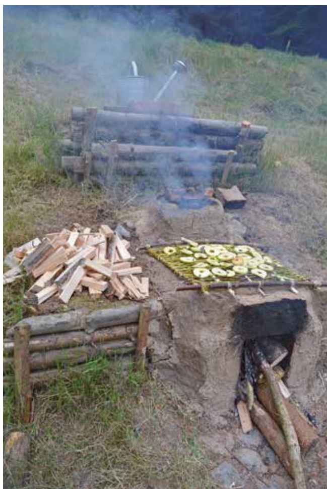
Obr. 3: Primitivní sušárna ovoce.