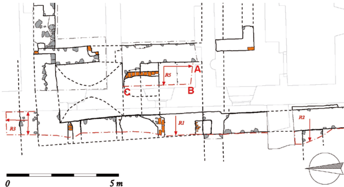
Obr. 2: Situování sondy S8 a řezu R5 v rámci barokního konventu

Poslední etapou, která v zásadě uzavírá stavební vývoj středověkého konventu, jsou přestavby a stavební úpravy provedené v pozdním středověku ( pozdněstředověká fáze ). Stavební práce probíhaly pravděpodobně v době stabilizace a obnovy kláštera po husitských válkách, kterou ukončil požár konventu na přelomu 15. a 16. století. 4 Pro tuto stavební etapu je charakteristické použití šedoběžové tvrdé vápenné malty jako pojiva, smíšené zdivo sestávající z kamenů a zlomků cihel i typická ostění vyzděná z vysokých gotických cihel (28 × 8 – 9 × 13 cm). V rámci této stavební etapy se opět upravoval interiérom románského objektu. Došlo k zasypání obou malých sklípků při západním průčelí. Jižní sklípek byl upraven na pekárnou/kuchyni, podlaha byla dosypáním zvýšena přibližně 0,5 m pod úroveň venkovního terénu a do gotické SZ příčky bylo vloženo topeniště pece (cca 1,5 × 1 m) stojící částečně na nově příděném soklu. Topeniště včetně soklu bylo vyzděno ze středněformátových cihel (30 × 6 – 7 × 14 cm) spojovaných na hlinu. 5