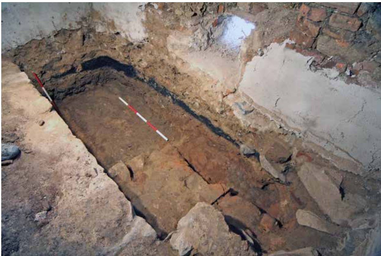
Obr. 4: Pohled na začištěnou část topeniště.