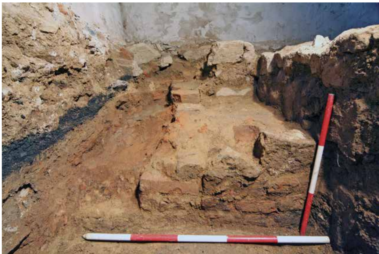
Obr. 5: Pohled na začištěnou část topeniště.

Zaklenutí se nedochovalo. Sondou, která byla hloubena v předpecí, se nepodařilo zachytit žádnou úroveň, o níž bychom mohli prohlásit, že byla pochozí úrovní kuchyně. Severní sklípek sice nebyl sondován, ale na základě nově prolomeného vstupu z interiéru lze předpokládat, že i zde zřejmě došlo ke zvýšení podlahy. V prostoru nad oběma bývalými sklípků můžeme hledat dymník a tedy zřejmě i tehdejší klášterní kuchyni.