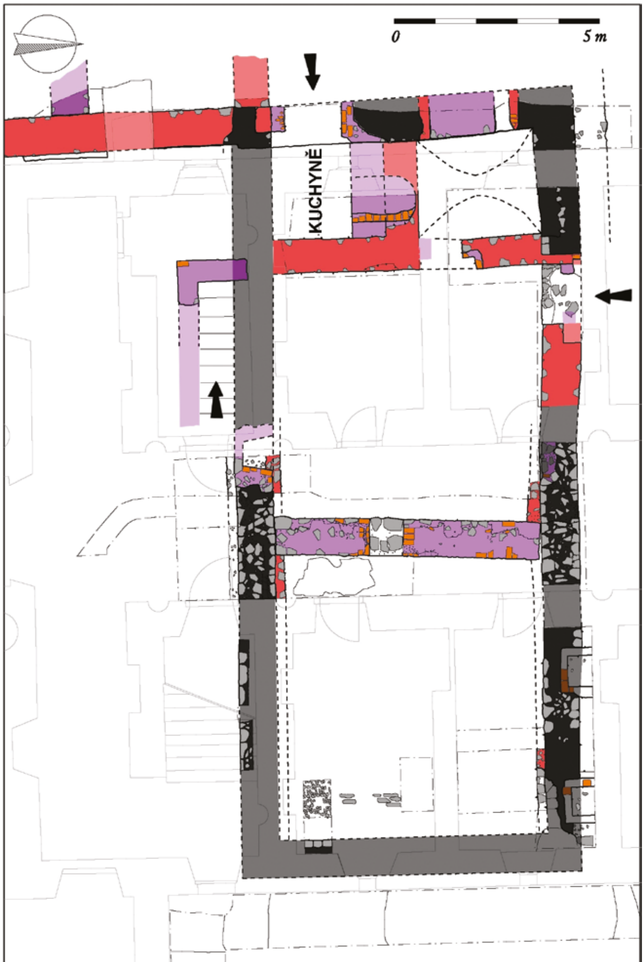
Obr. 6: Umístění kuchyně v rámci odkryté konventní stavby. Černá a šedá – románské zdivo; červená – gotika; fialová – pozdní gotika