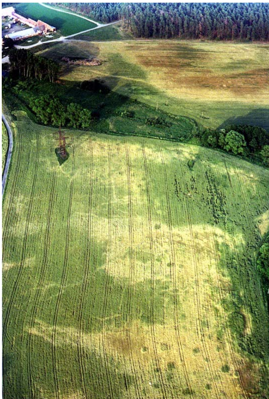
Obr. 3 Pohled na sídliště ve směru západ – východ Vacenovice (okr. Hodonín), Růdník