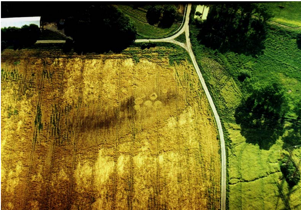
Obr. 2 Severozápadní okraj sídliště Vacenovice (okr. Hodonín), Růdník