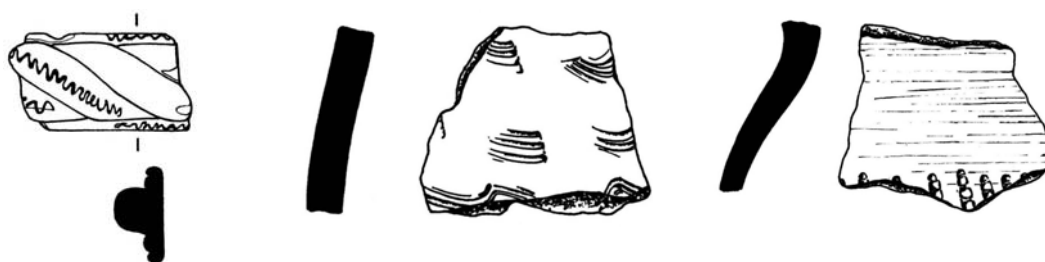
Obr. 5 Intruze laténského skla a slovanské keramiky v prostoru sídliště ze starší doby římské, (kresba M. Polák) Vacenovice (okr. Hodonín), Růdník