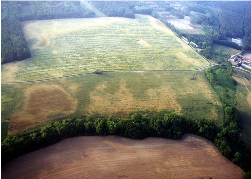
Obr. 1 Celkový pohled na lokalitu železářské osady ze starší doby římské Vacenovice (okr. Hodonín), Růdník