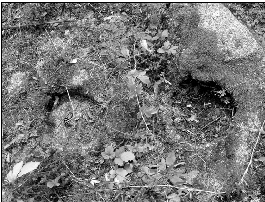
Obr. 2 Kúlové jamky uvnitř hradu