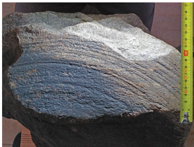
Obr. 3: Kutná Hora – pracovní plocha mlecího kamene z rudního mlýna s charakteristickými koncentrickými rýhami při bočním nasvícení. Foto: K. Pročka, 2024