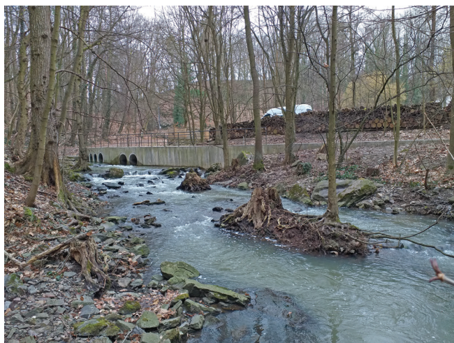
Obr. 2: Kutná Hora – celkový pohled na lokalitu nálezu mlecího kamene z rudního mlýna, koryto řeky Vrchlice.